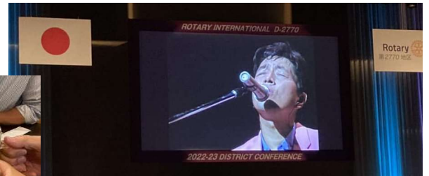
中村雅俊トークショー