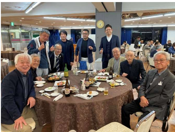
参加者 16 名今年度もチーム優勝を果たしました！