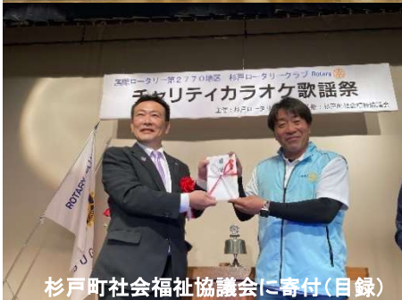
杉戸町社会福祉協議会に寄付(目録)