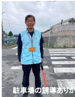
駐車場の誘導ありがとうございます