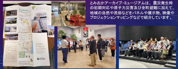
とみおかアーカイブ・ミュージアムは、震災発生時の初期対応や原子力災害及び全町避難に加えて、地域の自然や民俗などをパネルや展示物、映像やプロジェクションマッピングなどで紹介しています。