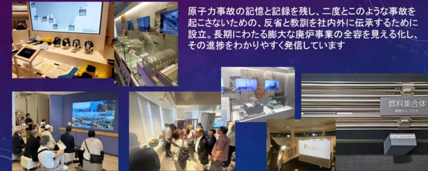
原子力事故の記憶と記録を残し、二度とこのような事故を起こさないための、反省と教訓を社内外に伝承するために設立。長期にわたる膨大な廃炉事業の全容を見る化し、その進捗をわかりやすく発信しています