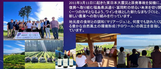
2011年3月11日に起きた東日本大震災と原発事故を契機に、復興へ取り組む福島県浜通り・富岡町の明るい未来を切り開く一つのカギとなるよう、ワインを核とした新たなまちづくりと、新しい農業への取り組みを行っています。